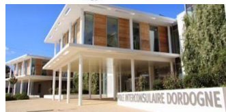
CCI Dordogne - Pôle Interconsulaire